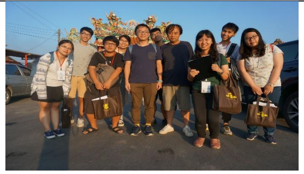
民調中心台西村面訪委託案