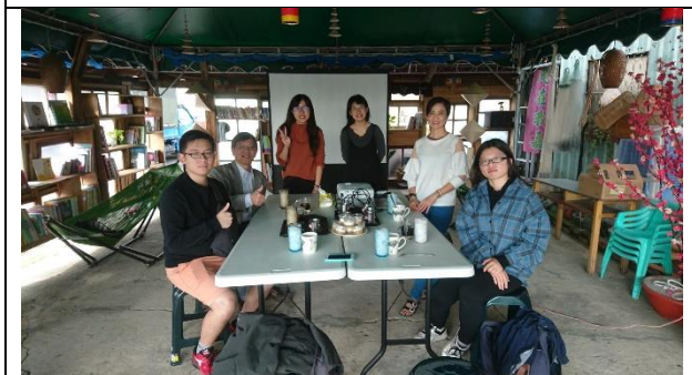
社會企業發展與實作工作坊